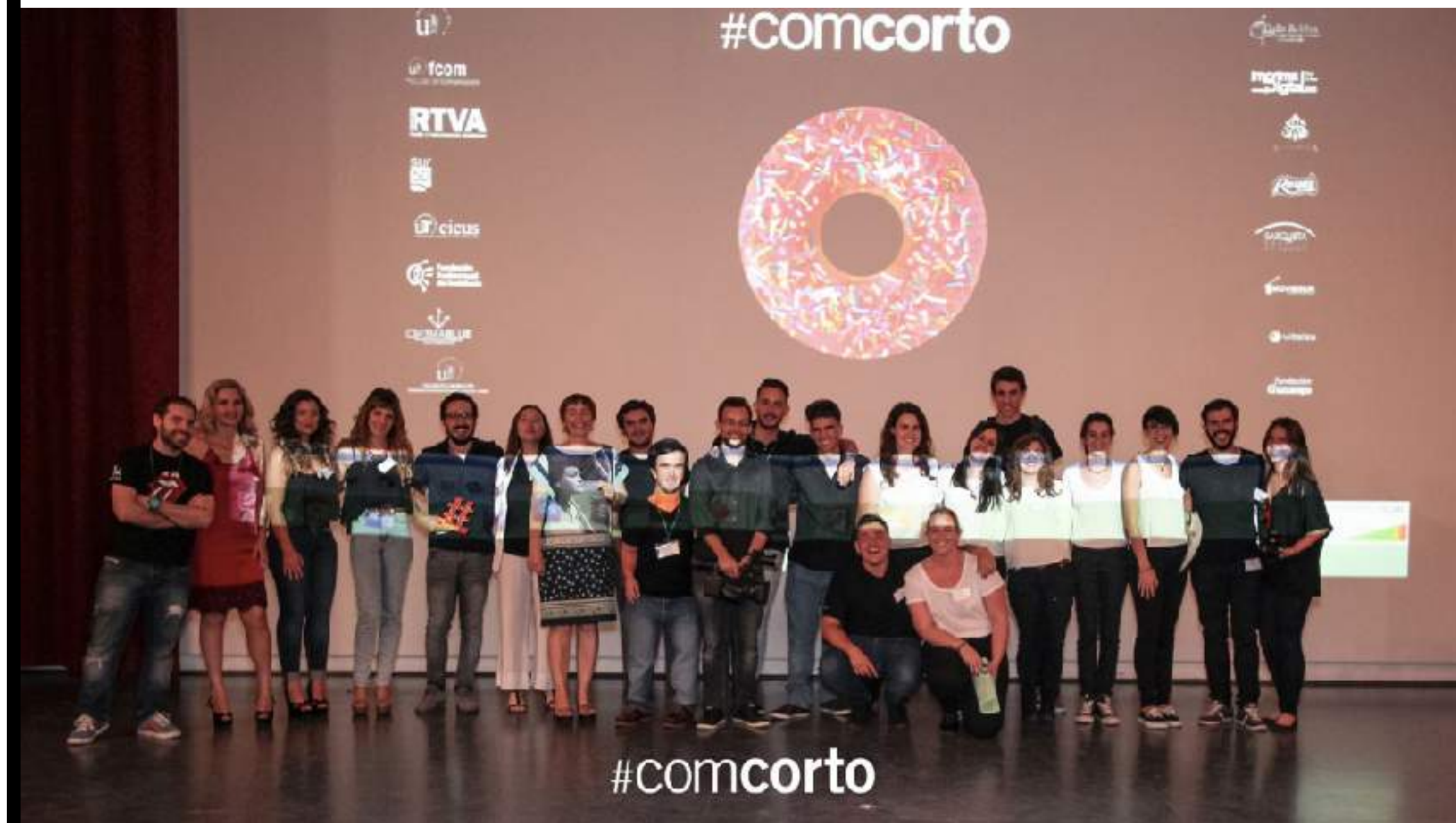
Organización 18ª edición #COMCORTO

El próximo 19 de mayo, #COMCORTO cumplirá su 20ª edición, habiendo abierto sus puertas a toda la comunidad universitaria pública andaluza y egresados de un año de antigüedad.